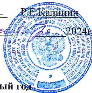
График выплаты стипендии на 2024/2025 учебный год